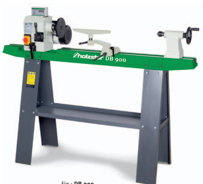
Fig.: DB 900 Avec équipement de série