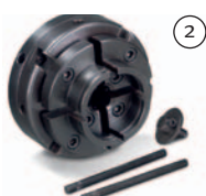
Mandrin 4 mors Ø 100 mm