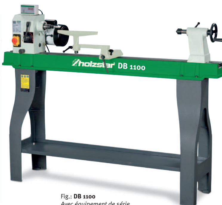
Fig.: DB 1100 Avec équipement de série