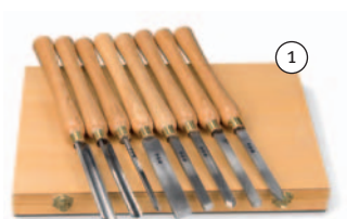
Jeu de 8 outils à bois

Avec socle de série et copieur optionnel (Code article 593 1102 - voir page suivante)