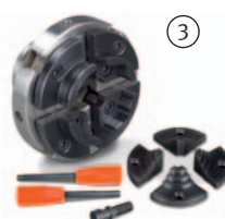
Kit mandrin 4 mors Ø 100 mm