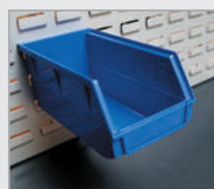
· Bac à bec sur panneau cranté