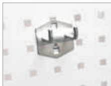
Crochet double 90° Dim. (L x Ø) : 50 x 6 mm Code article : EDFG0205 ④ Prix € hors TVA