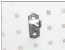
Crochet simple 90° Dim. (L x Ø) : 50 x 6 mm Code article : EDFG1405 ④ Prix € hors TVA