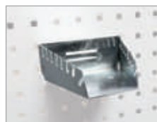
Support clés 8 crans Dim. (L) : 150 mm Code article : EDFG1101 ④ Prix € hors TVA