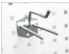
Crochet triple 120° 2 plats Dim. (L x Ø) : 150 x 6 mm Code article : EDFG0901 ④ Prix € hors TVA