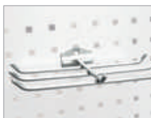
Crochet universel 120° Dim. (L x Ø) : 240 x 6 mm Code article : EDFG0601 ④ Prix € hors TVA