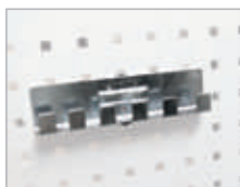
Porte-douille 6 douilles Dim. (L) : 195 mm Code article : EDFG2101 ④ Prix € hors TVA