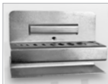
Support pour 10 clés BTR Dim. (L) : 120 mm Code article : EDFG2101 ④ Prix € hors TVA