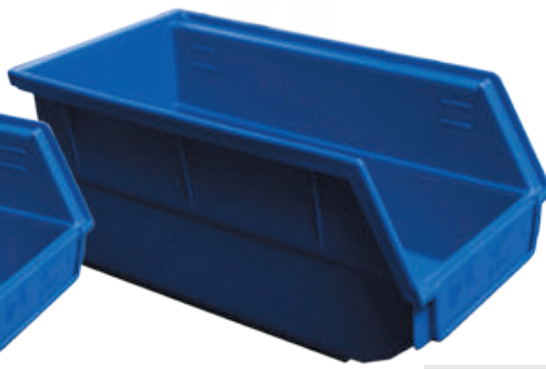
Fig.: Bac profondeur 270 mm