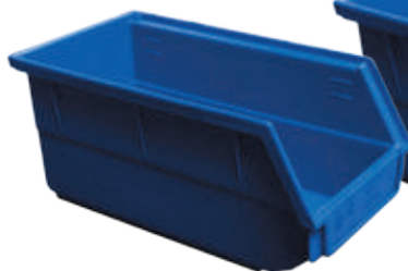
Fig.: Bac profondeur 190 mm