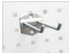
Crochet double 120° Dim. (L x Ø) : 150 x 6 mm Code article : EDFG1506 ④ Prix € hors TVA