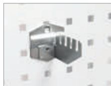
Support pour scie 4 crans Dim. (L) : 80 mm Code article : EDFG2201 ④ Prix € hors TVA (2 sont nécessaires)