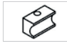
• Contre forme coulissante