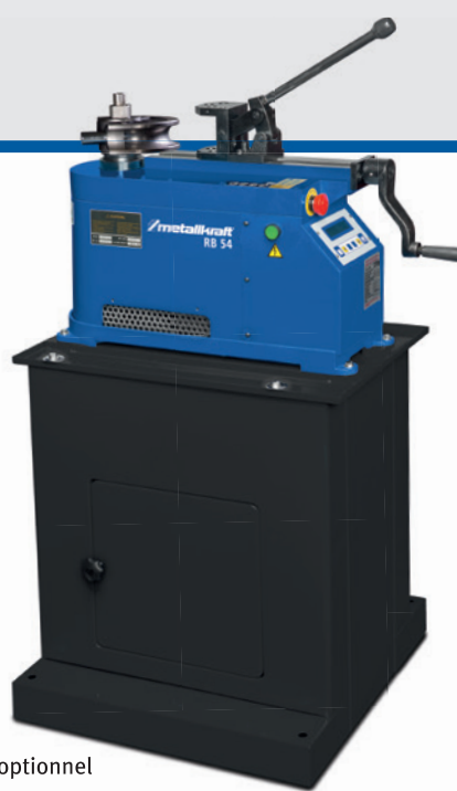
Fig. : RB 54 • Avec socle optionnel