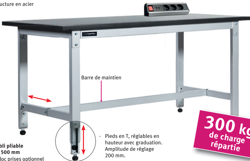
Fig. : Etabli pliable largeur 1500 mm · Avec bloc prises optionnel