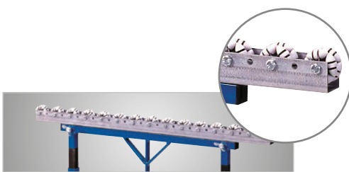
Fig.: MS 4 R