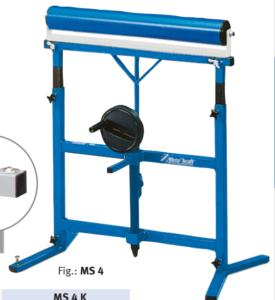
Fig.: MS 4