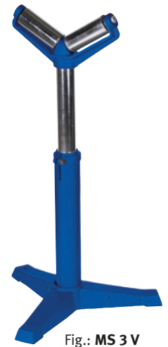
Fig.: MS 3 V