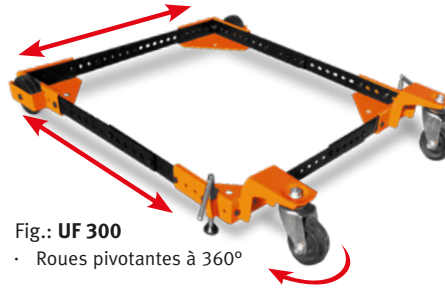
Fig.: UF 300 • Roues pivotantes à 360°